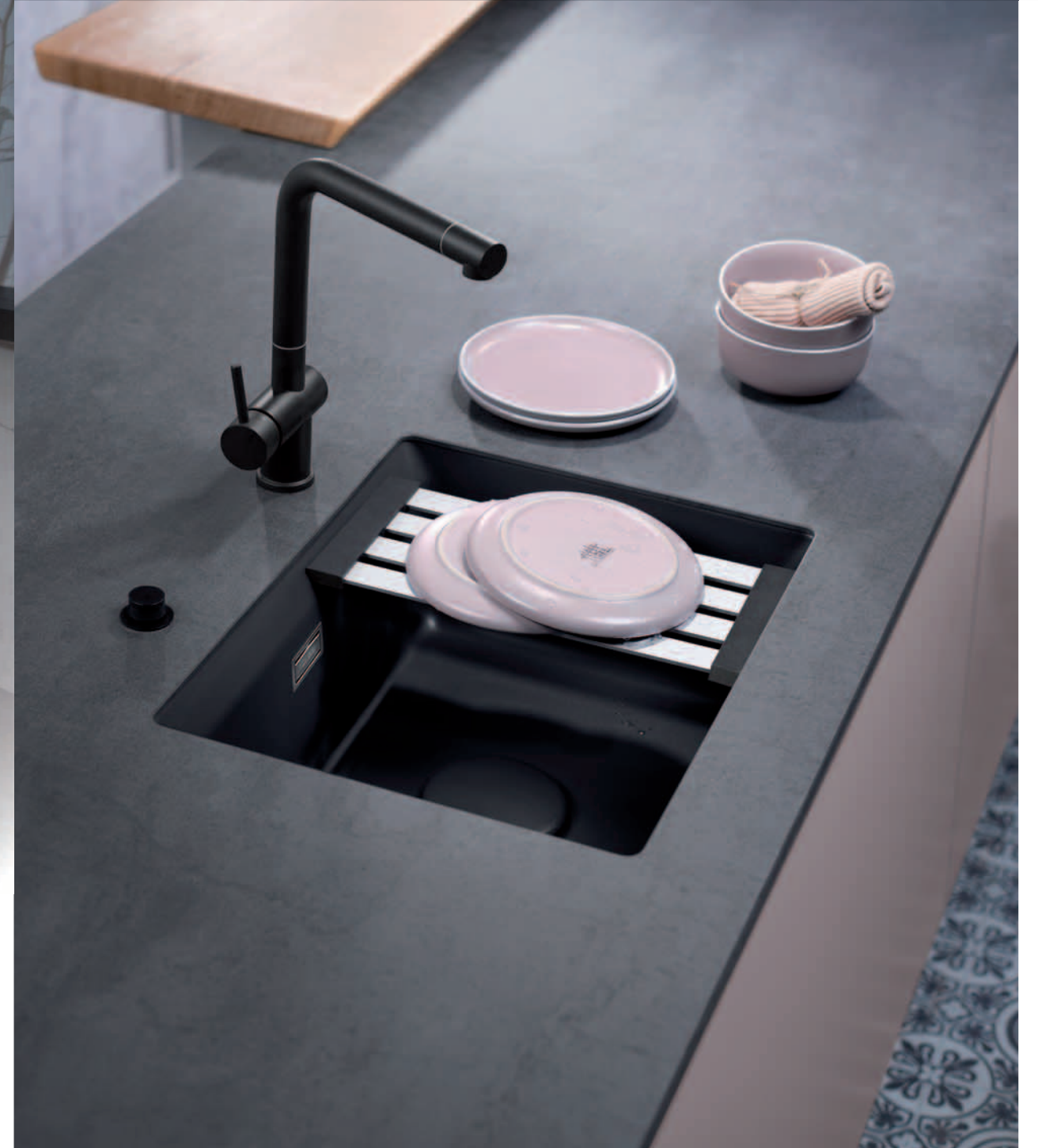
Rechts: KARA 50 U/g in Schiefer inkl. Medio-Matte in Alu mit Premium-Drehexcenter, Sink Cover Keramik und Armatur LIVE in Schwarz