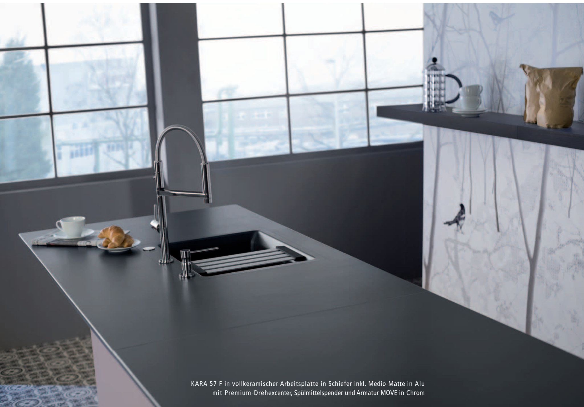
KARA 57 F in vollkeramischer Arbeitsplatte in Schiefer inkl. Medio-Matte in Alu mit Premium-Drehexcenter, Spülmittelspender und Armatur MOVE in Chrom

Mit dem Einsatz der MEDIO-Matte verwandelt sich das auf den ersten Blick unscheinbare Design in ein flexibles System: Platz schaffen im Spülbereich, abstellen, abtropfen lassen, in und neben der Spüle ... die MEDIO-Matte kann selbst als Topfuntersetzer eingesetzt werden.