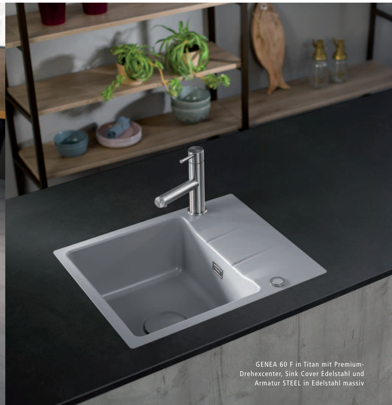
GENEA 60 F in Titan mit Premium-Drehexcenter, Sink Cover Edelstahl und Armatur STEEL in Edelstahl massiv