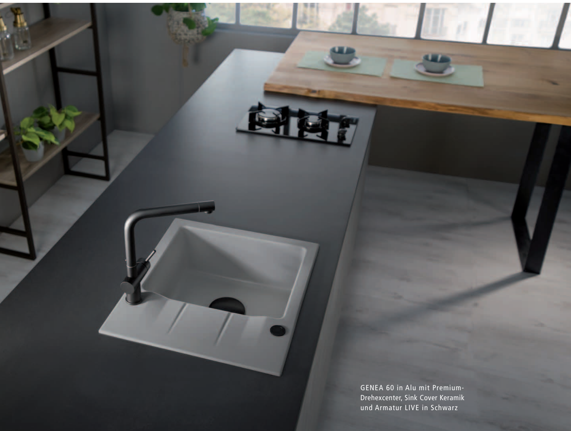
GENEA 60 in Alu mit Premium-Drehexcenter, Sink Cover Keramik und Armatur LIVE in Schwarz

Auch in Kücheninseln oder engen Einbausituationen bietet das praktisch große Becken mit der Abtropffläche und optionalem Zubehör eine gute Organisationseinheit zum Spülen und Vorbereiten.