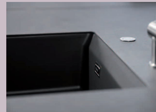
Oben: KARA 50 U/g in Schiefer inkl. Medio-Matte in Alu mit Premium-Drehexcenter und Armatur LIFE in Schwarz

Die neue KARA 57 gibt es als Einbauspüle, als flächenbündige Spüle und Unterbauspüle in 15 attraktiven Farben.